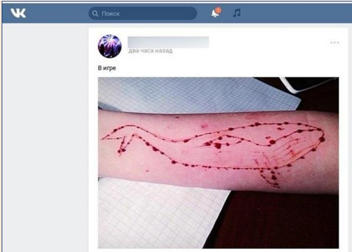
Гра в синіх китів

Найчастіше воно складається із завдання собі ушкоджень: наприклад, вирізати на своєму тілі кита чи напис, і все це потрібно знімати на фото чи відео.